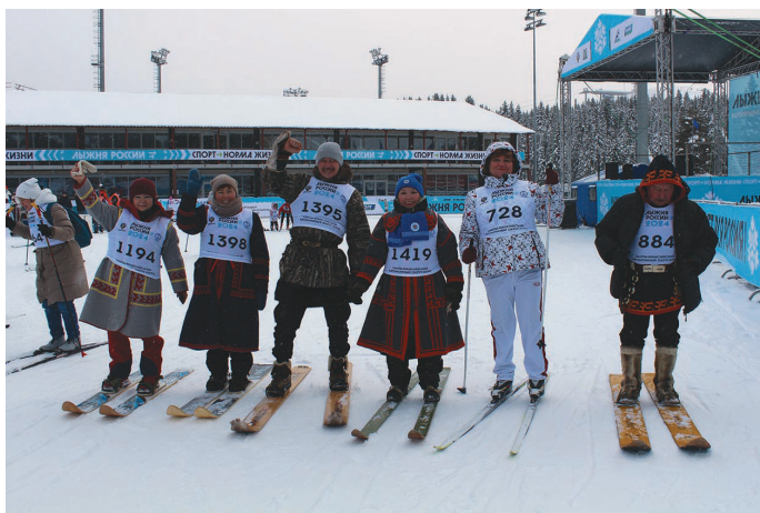
Ёсал хайтум мәхум

Матьёмас, тамле ёмас ос э́рнэ касылыт варыг- лавет. Ёст олнэ мирн тув алуңкве сака пўмыш.