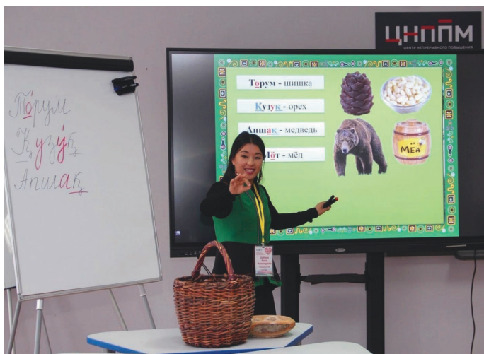
Тох ты латың ханищтэгыт