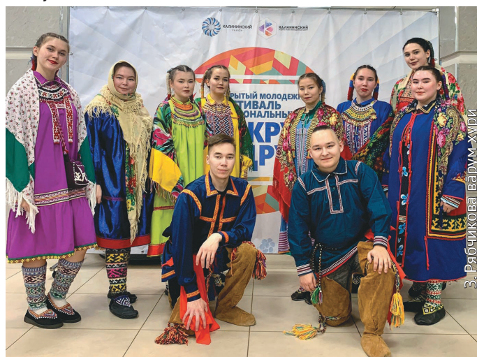
Ханты, мәнщи няврамыт

агит, пыгыт ханищтан мәнныл тән юв ялнэ билетаныл магсыл ойтум олнаныл ювле кетает. Ты элы-палт тән 20 сөтыра солкөвил майвёсыт, ты талныл 30 сөтыра солкөвил акв тал сьт тастункве патает.