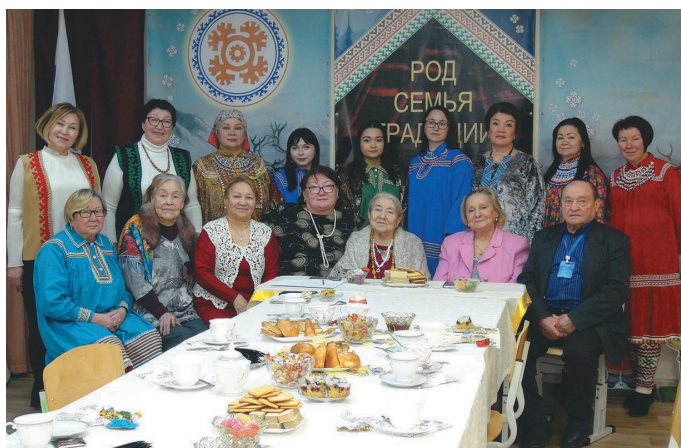
«ДЭКОЦ»-колт акван-атхатыглам мāхум

С осса мирыт пёс наканыл, щāнь лātңаныл элаль тотнэ мāгыс нйврамыт ханищтан центр-кол Ханты-Мансийск ўст рўпиты. Сāv мāхумн ос нйврамытн тав «Лылың союм» наме хосыт вāве. Ты этпост тот рўпитан хōтпат «Люди одного очага» акван-хōнтхатнэ нак вāрыгласыт. Тув ханты ос мāньщи лāтың вāнэ яныгпāла хōтпат вōвыглавёсыт.