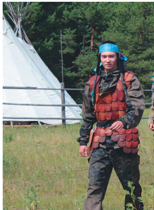
Николай «Мәнь Ёсквет» лахрыл масхатас

Ты коньпал концертыт вәрыглан порат тав эргыт ёнгын мәгсыл ищхыпың утыт аквписыг щёпиты- янэ, кәсың щаңкв ёмщакв вос рүпиты, тамле рүпата тот тав вәрыс.