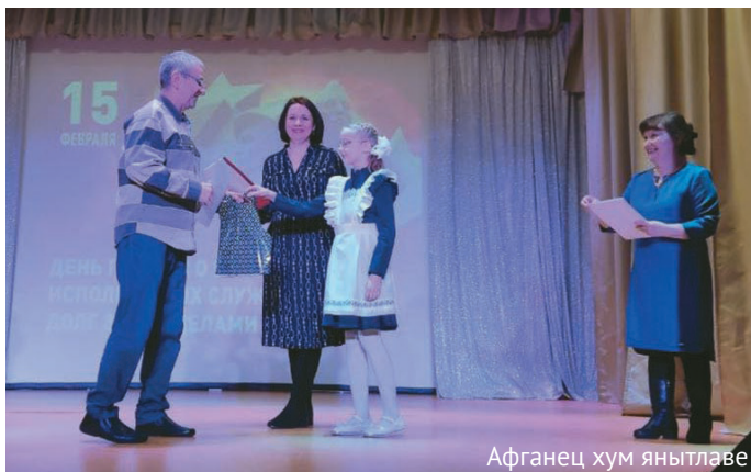
Афганец хум янытлаве

К ӕсың тӕл рётың юсвой ӕтпос оигпан порат мӕн хум мӕхманув янытлыянүв. Ты накт пӕвлың миркол ос школат рупитан мӕхум акван-юрщхатым акв мероприятие вӕрыгласыт. Тох рётың юсвой ӕтпос 15 хӕталӕт клуб-колт хӕнтлан мӕт ӕлум хум мӕхум ос школат ханищтахтын хум нӕврамыт мӕгыс янытлан вӕрмаль ӕлыс.