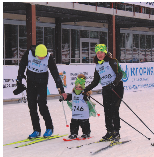
Е. Гоголева щёмьятэ ёт

Ам нэмхуньт ёсал ат ёмыгтасум, мощ тәрви- тың о́лыс, ос ёсаг нэма- тыр э́рнэ вóил ат сарт- весыг, мощ волькыг о́лсыг. Мощёрт «Югор- ский лыжный марафон» на́мпа акв тамле касыл вараве, ам тот хайтуңкв о́с патэгум. Ань мощ щё-