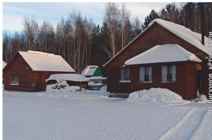
Мулумья Пёс павыл

тэв. Ам община нэпаканэ хунь вәрсанум, Мулумья пёс павыл ос ляпат өлнә мәт амки нупылум хасанум. 17 нот порат тот мәнщиит өлсыт. Пәвлув ляпат өлнә пёс савынкан округувт үргалан мәг ань вәрвес, пөх хөтпат тув нас тох ат тәртавет. Пёс порат мәнщиит мөт мән вәнтласыт, өлнә пәвланыл ос Мулумья намаясаныл. Ань ты павыл Хонтаң район Урай үс ляпат өлы. Мән пәвлув Мулум я вәтат унлы. Мәхум нәиңхәпыл тыт яласыт, ань я витэ мәниг