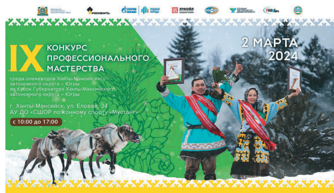
Сәлыл каснэ мән мәхум үравет

снегоходыл мүйлуптаве. Мүйлуңкве ёхтын мәхум йильпи тәнүт тот ёвтуңкве вөрмөгыт. Ёрколыт түщтавет, тот атың тәнүт тах әрталаңкве рөви.