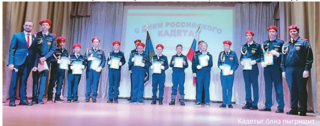
Кадетыг ӕлнӕ пыгрищит

Лүймә сәрипос (Северная заря) № 4 (1310), 22.02.2024 Соучредители Дума, Правительство ХМАО – Югры Издатель Департамент внутренней политики ХМАО – Югры