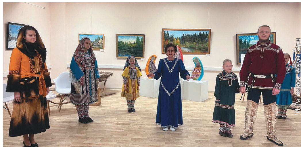
Мария Эккерт котилыт лүли

Тән хөнтлам тәлыт порат яныгмасыг, омаэт сәв рупитас, әтятэ хөнтлас. Агм ос нюлмианэ паттат