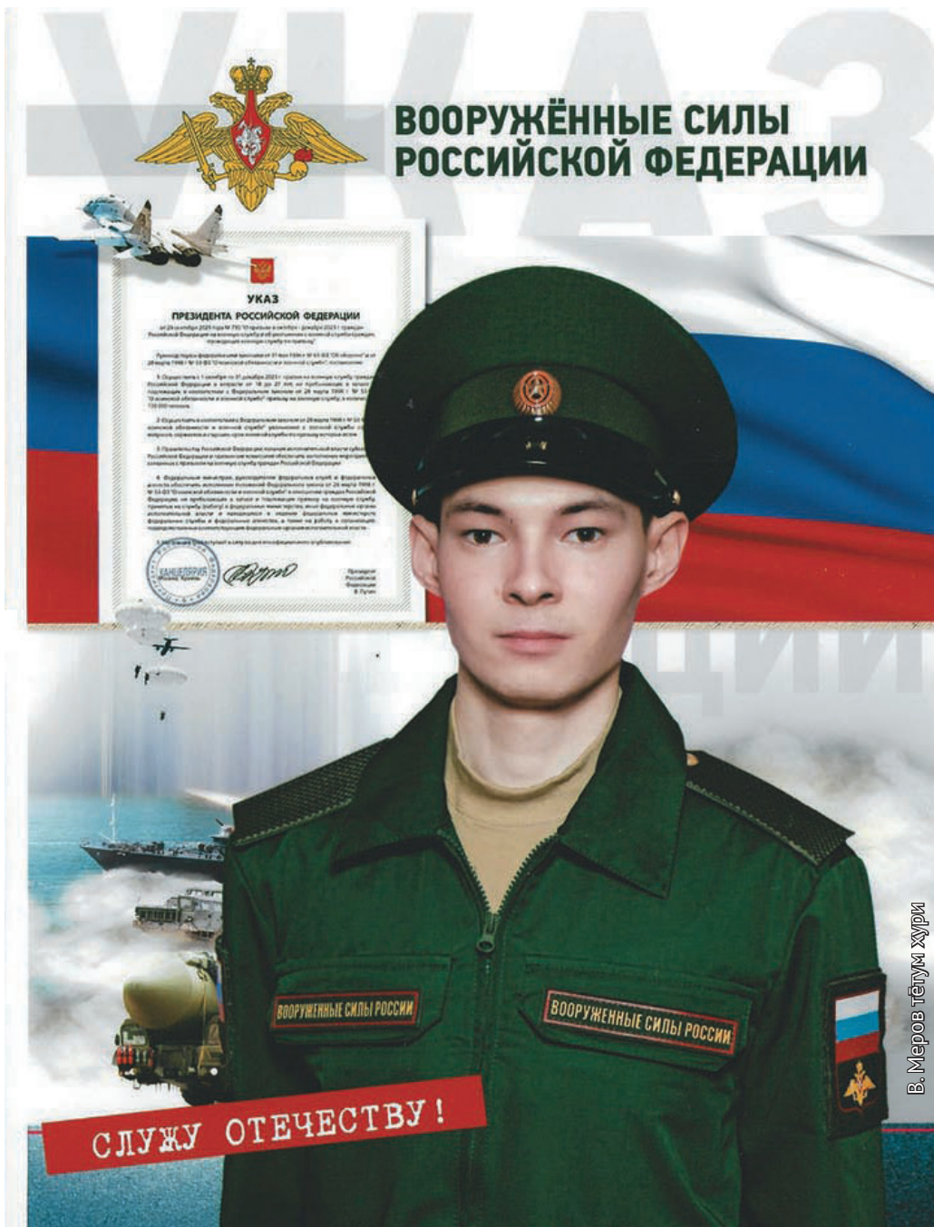
В. Меров тегум хури