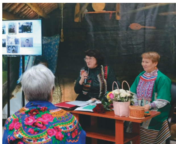
Н.Н. Вахрушева-Чайникова такви рүтанэ ос өлупсатэ урыл потырты

ёми ос вөр мә суит пуссын хұлыянэ, вәганэ. Хөнтаң мәньщит тәнки самын патум мәнаныл акваг үргалым ос эруп-тым өньщияныл.