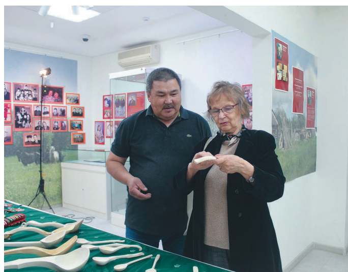
Н.Н. Фёдорова ёт потырты

сыт «Бураныл» минуңкв эри. Мән «Бураныл» тәл сыс тот яласэв. Тәлы акв лөңх вәрөв, туй мөт лөңх оньщөв.