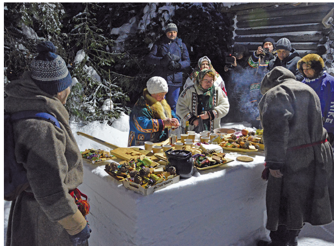
Пурлахтын пасан ватат

М әньполь Этпос 3 хөталэт «Төрүм Маа» музейт пöслым хуритыл «Дневник экспедиции. Пугоры, Теги» нампа суссылтап блыс. Та хөтал мәхум потыртасыт, хумус Хальүс районт «Тылащ пори» нампа пурлахтын вәрмалъ вәрыгласыт, сосса мир аквьёт хумус атхатыгласыт ос пурлахтасыт.