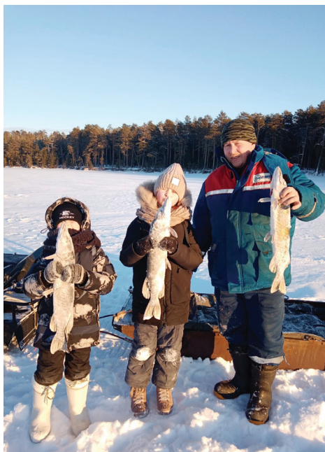
Ойкатә нъяврамаге ёт хұл пувсыт