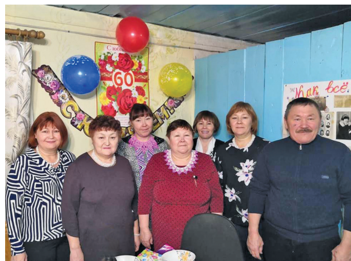
А.И. Назаренко апшитэ ос эщанэ ёт

А нна Ильинична Назаренко, такви бпарищ наме Алгадьева, Хальүс район Хулюмсүнт павылт блы. Тав ват арыгкем тал связь щирыл рүпитас. Нэпаканэ щирыл рүпитам мятэ «ГазпромТрансгазЮгорск» блыс.