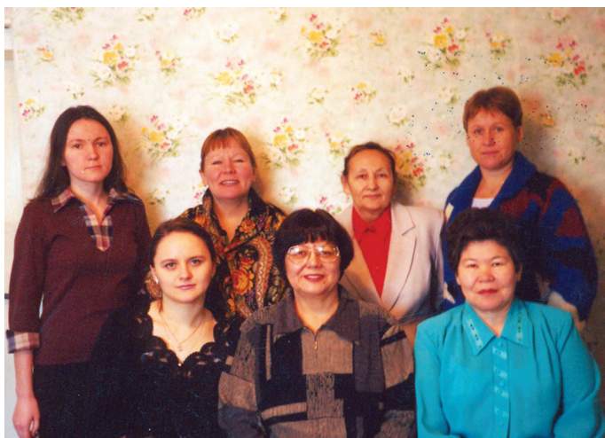
Хальүст рүпитам нэ, 2000 тал