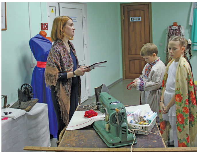
Нэ няврамыт юнсахтуңкве ханищтыянэ

Амти ос проект хансыгласум, ты кастыл Президент фондыныл олныл тәстувәсум, ань няврамыт ёт ханищтапыт вәрыглэгум. Ам палтум сосса щөмьятныл, сәв нявра-