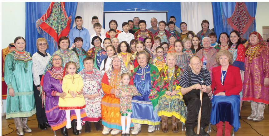
Саранпавылт атхатыглам махум