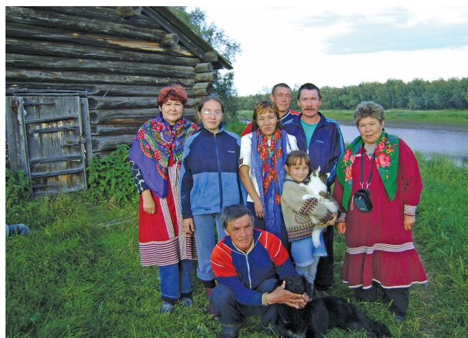
Юхангорт павылт, 2009 тал

Р ётың юсвой этпос 8 хөталэт Хальүст олум пёс йис потрыт акван-атнэ кол 30 талэ төвлынув. Районув янытыл өлнэ латың ванэ махум, пёс йис потрыт ос эргыт акван-атнэ хөтпат тамле кол өньцуңкве сака тахсыт.