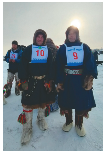
Салы үрнэ хумыг