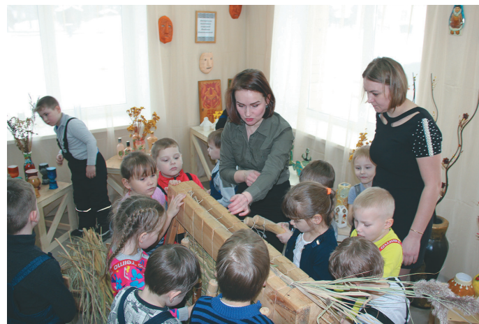
Т.В. Хомякова тәвар сагнэ ут суссылты

Молты тәл сыс мән ат проектыт вәруңкве патсув, ты мәгсыл президент