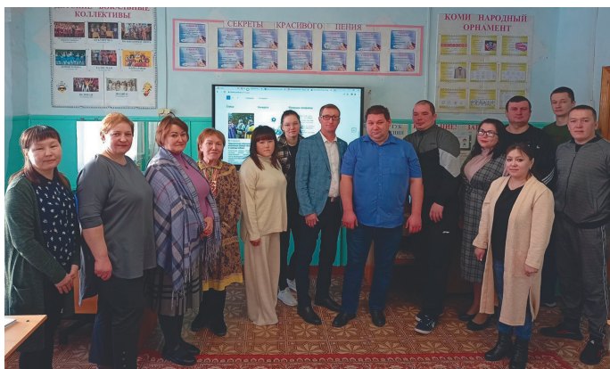
Хаництапн ёхталам хөтпат

Нэпак ловиньтан колт рүпитан хөтпатн мән пүмашипа ләтың лавөв, тән касың тәл рётың юсвой этпост щянь ләтңаныл тох янытлыяныл.