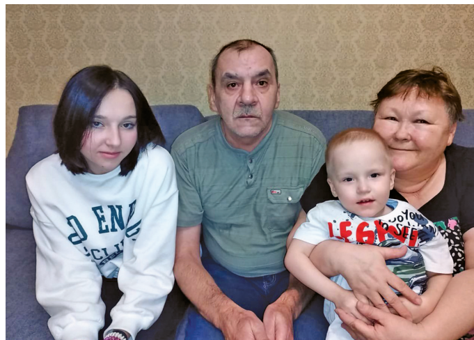
Анна ос Сергей апраген өт

Тэлы сыс сакныл матыр хорамыт харты. Эщанэ, әгитэ ос рүтанэ пуссын сакныл хартым турлөп-сыл, пальсакыл мүйлупатасанэ. Эрнэ сак тав яныг үсытт өвты, Санкт-Петербург, Тюмень, Югорск ос мөт үст ялнэтэ порат