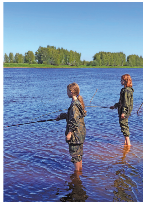
Ѓииг туи нясләг

мың щәмьятныл, нусаг блнә аҗиришит-пыгришит ёхталәгыт, мән акваёт матыр щаквщёв.