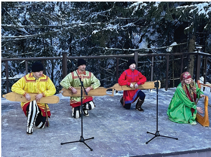
«Сәлы лёңх» театр