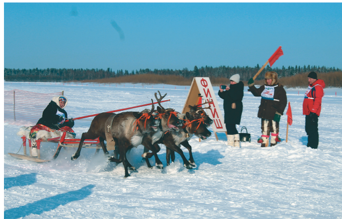
Нэкет бс касэгыт