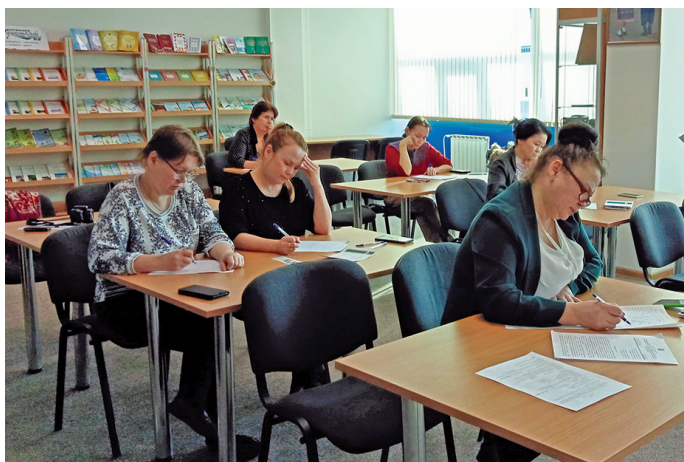
Мәньщи потыр хансум хөтпат