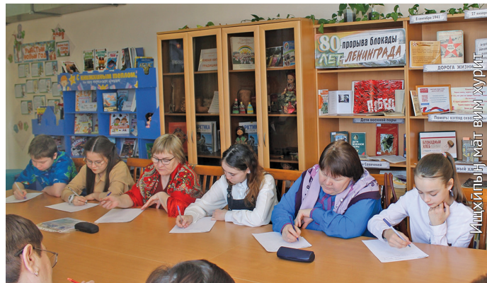
Нъяврамыт потыр бс хассыт

Титыт потрув Ас-угорский институт ос «Лүимә сәрипос» редакция ищхипың ут лөпсыг урыл потыртасүв. Ань тот сака сав эрнэ потыр хөнтуңке рөви. Институт лөпсәт нъяврамыт магыс хансым сав хорамың нэпакыт блэгыт, тән хурум ләтңыл