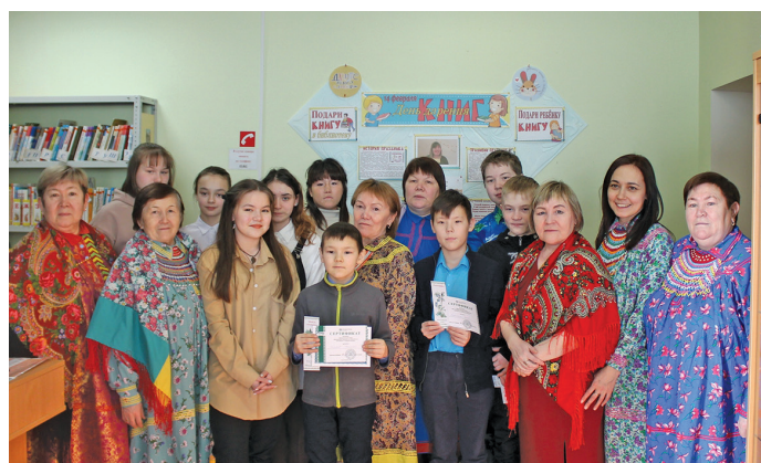
Потыр хансум мяхум

хансымат: руц, мяньщи ос английский ләтңытыл.