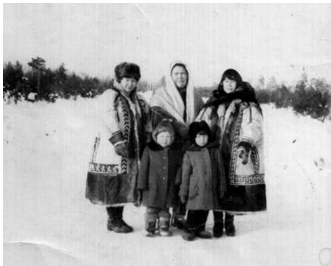
П.Н. Алгадьева котильт лөбли

Лүймә сәрипос (Северная заря) № 5 (1287), 09.03.2023 Соучредители Дума, Правительство ХМАО – Югры Издатель Департамент общественных, внешних связей и молодежной политики ХМАО – Югры