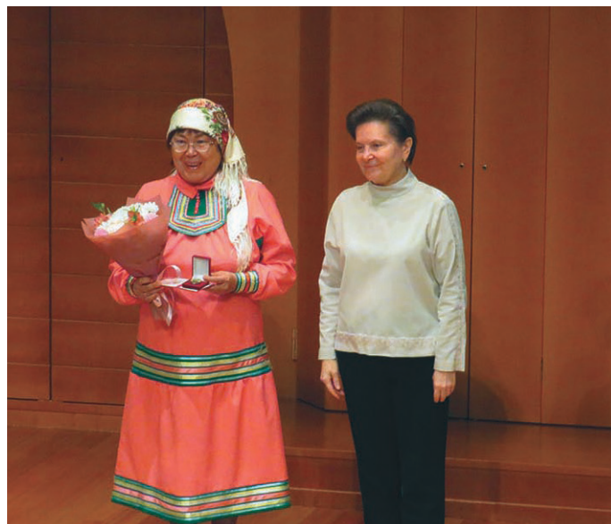
М.П. Куклина округ кўцаин Н.Комарован янытлаве

Школавт яныгщ ханты няврамыт ханищтахтэгыт – Казамкиныт, Айваседа, Сардаковыт, Иуси, ёрн