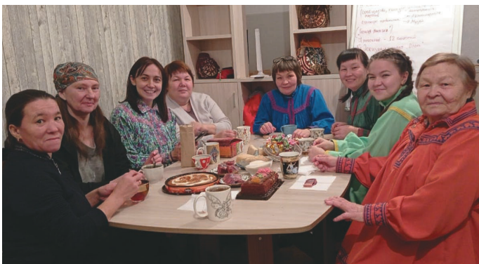
Щаквщункве ёхталан нэкет

– «Сделано в Пауле» мастерской колувт ман 2019 тал пасныл щаквщев. Овлэт нэпак бщнэ колт атхатыгласув. Ётыл мён ойкамён-тыл блнэ кол унттысамён, акв колнак мащтырлан колнакыг щёпитаслумён, тот атхатыглаңкве патсүв.