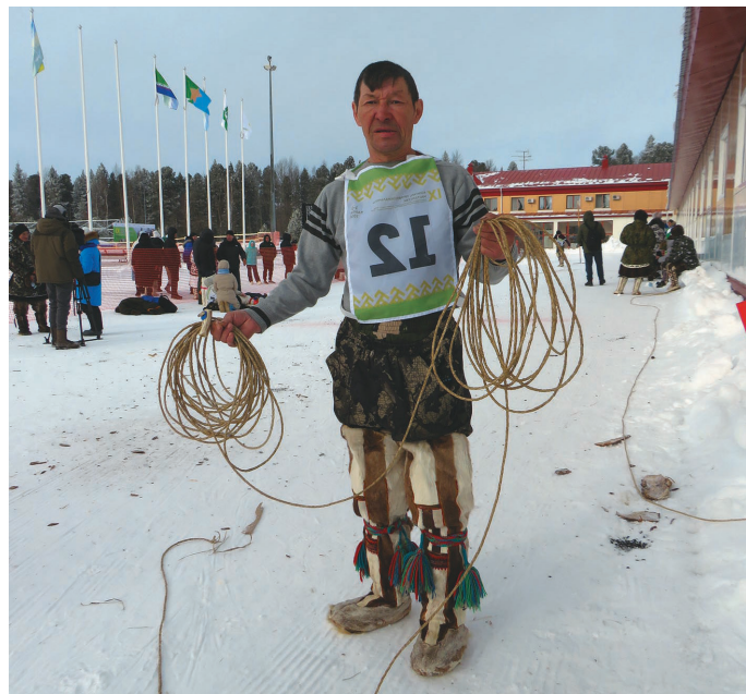
Салы үрнэ хум А.С.Тарлин тыньсаң рёпыгыт

Ты тәл кит йильпи конкурсыг вәрвэсыг, акватэ «Стойбищная семья – долгожитель» – Белоярский районтт олнэ Тасьманов колтәгыт