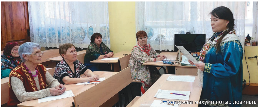
А.Алгядьева махумн потыр ловиньты

В әим махум рүпитәгыт, хот яласәгыт, ат астагыт. Аквнакт мән пәвлут Хальүс район Хулюмсүнт пәвилт 16 хотпа диктант хансуңкв ёхталас. Тахольтыл школаң кұщай нә аквьёмт тәратахты, диктант хаснә янас кабинетыл майлавев.