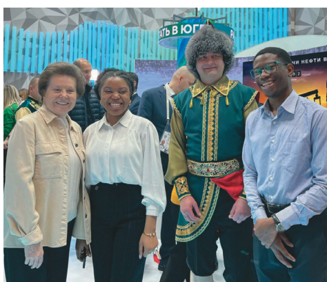
Н. Комарова мир ёт пöслахтас