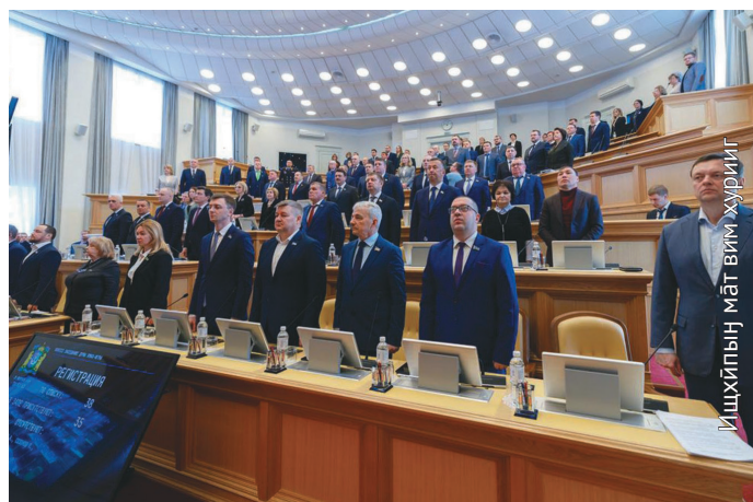
Сапрәнияныл элы-пәлт гимн-эрыг хүйтләгыт

рүпитаңкве те минәгыт, тән ос аквтох ты олныл ойтуңкве вәрмавет.