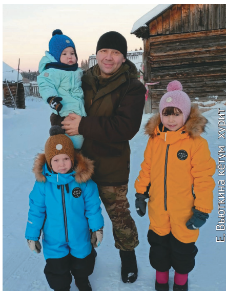
Александр ойкатэ нъявраманэ эт лбли

М аньщи мирув халт щаквщин хотпа сав блы. Хальүс район Саранпавыл нэкет щаквщин коланыл «Сделано в Пауле» намаясаныл, тот тан йинсахтэгыт, юнсахтэгыт, тынтлахтэгыт.