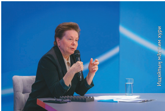
Ишхйпын мәтвим хури