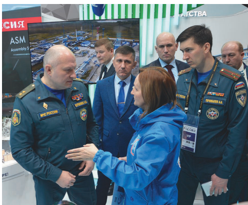
МЧС министр хум А. Куренков