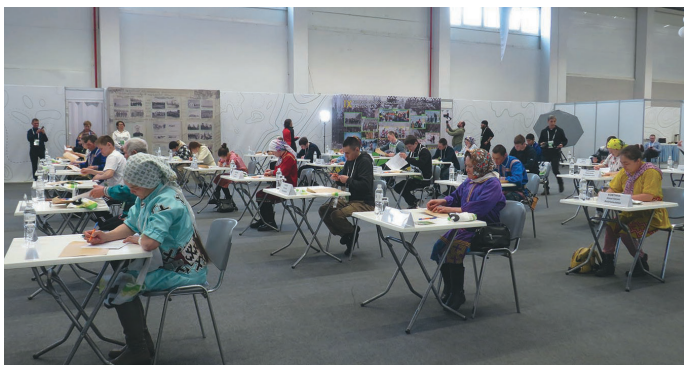
Салы үрнэ мэхум нэпакыт хансэгыт

блупсав, тэлэ-тувэт салыл яласэв. Ам тыт ань хурум номинациятт бовыл места висум, ос нөх-патнэм, ат номсысум. Хунь намум лаввес, вәим щәгтсум.