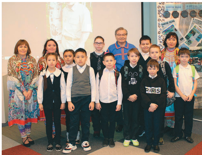
Ёхталам нъяврамыт ёт

Р ётың юсвой этпос 21 хөталэт щань латың янытлан мирхал хөтал блыс. Ты кастыл Ханты-Мансийск үст «Язык – душа народа» нампа пұмаш тэла вәрыглавес.