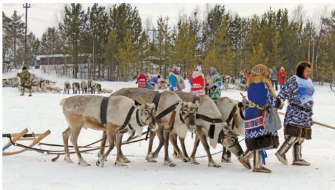
Нэг-хумыг касуңкве ёмёр