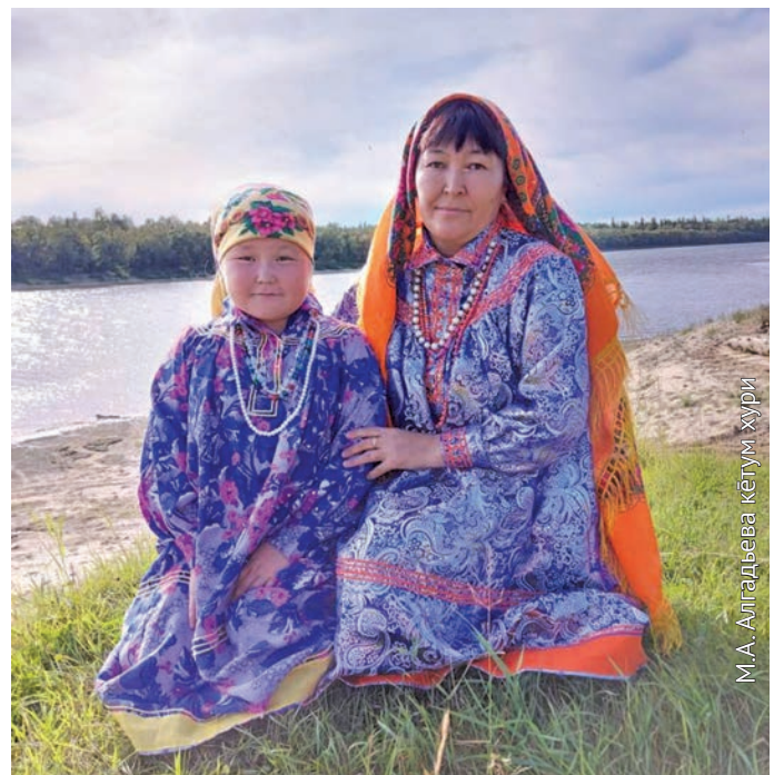
М.А. Алгадьева Полина агитэ ёт пōслым олы

Мәнщи, ханты ос ёрн мāхманув тув хасхатуңкве ос эри. Округ мирколт ищхйпың лōпс оныщи – https://kmns.admhmao.ru/ , хоты нэпакыт акваг-атуңкве ос хоталь кетуңкве эри, тот пуссын хансым олы. Тувыл кәсың районт ос яныг үст мирколытыт ты рұпата вәрнэ хөтпат ань олэгыт. Тән палтаныл мāхум китыглахтуңкве вөрмөгыт.