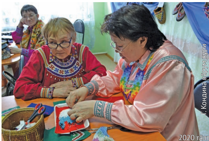
г. Кондина вәрүм хури 2020 тәлт

Ханищтап щөпитан тыглаве. Ты рүпата ань мәгсыл Хальүс район таимәгсыл вәрыглаве, миркол пәлныл олн тәс- Хальүс районт блнэ нә