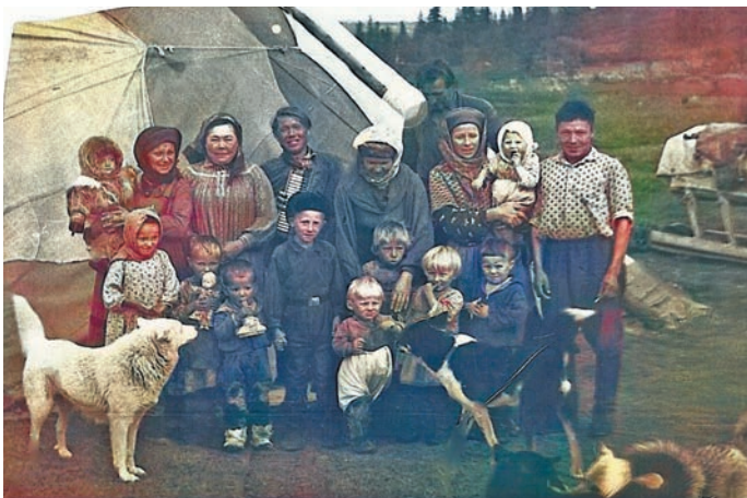
Лазар Михайлович сәлы үрнэ мәхум халт ёмаспал нупыл лөли