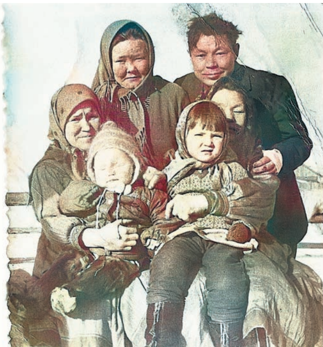
Светлана щар мән, сәнсыт үнлы, омаге-әтяге лөлө