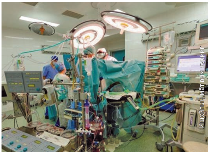
Ишхйпын мāt вим хуринг