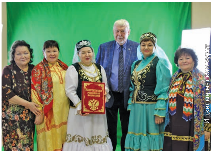
Югорск үст öлнэ савсыр мирыт