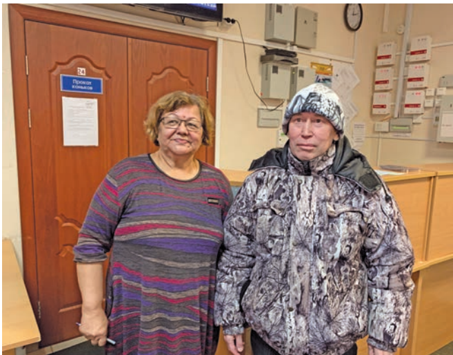
С.А. Попован Уй ййквнэ урыл титыглавес