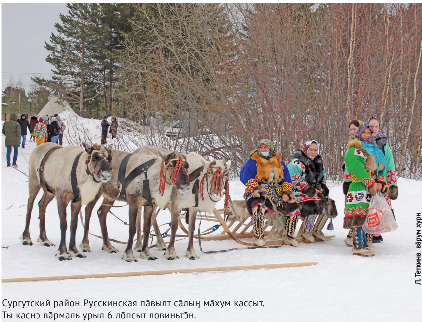
Л. Теткина вэрүм хури

Сургутский район Русскинская павылт сáлың мáхум кассыт. Ты каснэ вáрмáль урыл 6 лóпсыт ловиньтэн.