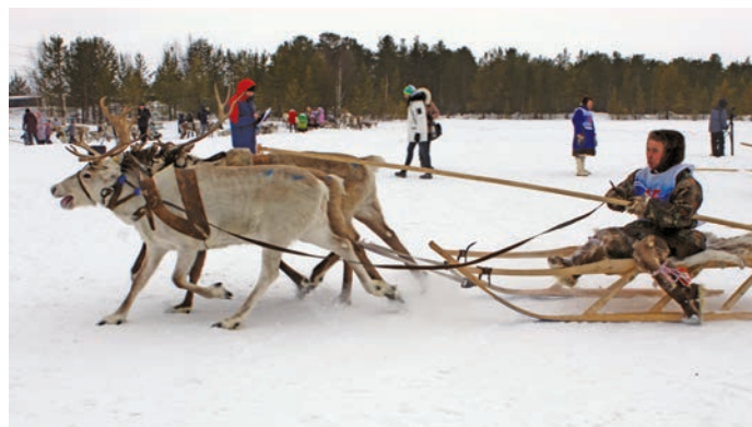
Салың хум нуйхаты