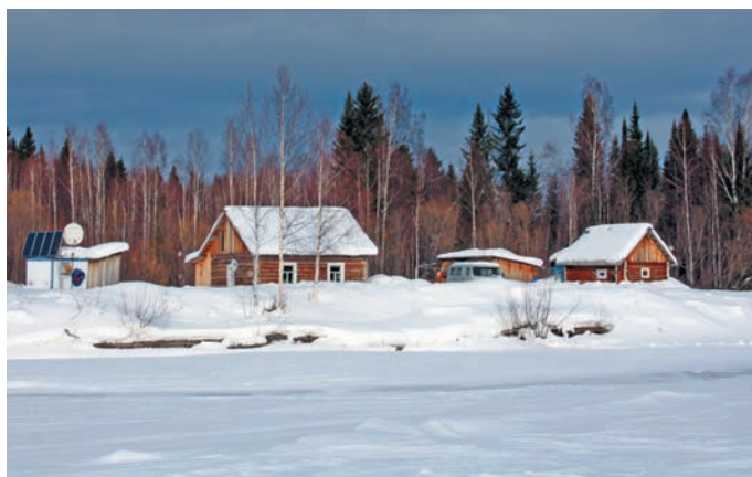
Ушма пәвилт, 2016 тәл