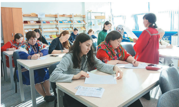
Ма́хум потыр ханты ләтңыл хансэ́гыт

Тувыл 2020 тә́л пәсныл сә́в х́отпа ищхйпың ут хосыт хансэ́гыт. Төва э́рың яласа́ңкве ат вёрми манос нас ат а́лыми ма́н палтув ё́хтуңкве, тох хан-