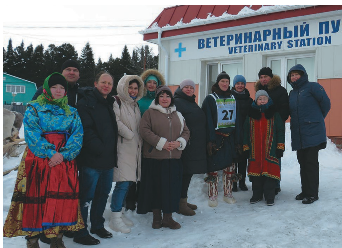
Сәлыт пусмалтан мэхум акван-атхатасыт