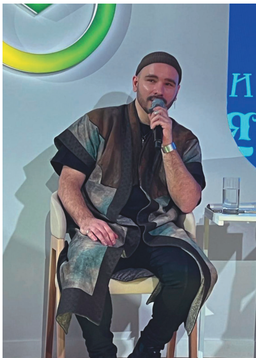
Эргын хум Гурудэ