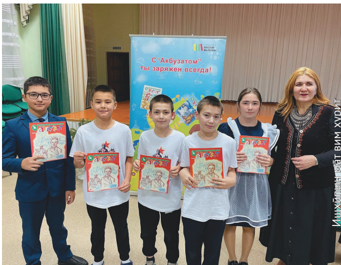
Няврамыт «Акбузат» нәпак ёт ләлөгыт

Мән кӯщәув ёт вәтихал хотты үсанувн ос пәвланувн ялантәв, тот няврамыт ёт хөнтхатыгләв, тән ётаныл потыртәв, акваёт пәсләв. Тәнанылн суссылтәв, хумус мөт няврамыт пәслысыт ос тән хурияныл журналн вәрсанүв, тән мәгсыланыл ты яныг щәгыт өлы. Кәсың әгирищкве ос пыгрищакве хунь такви хуритә ос кәтыл пәслум хуритә кәсалы, татем та щәгыт. Сәв няврамыт тәнти потрыт хансәгыт, тәнаныл мән журналн вәриянүв. Школат ос мәнә няврамыт садикт няврамыт акваёт пәслыянүв,