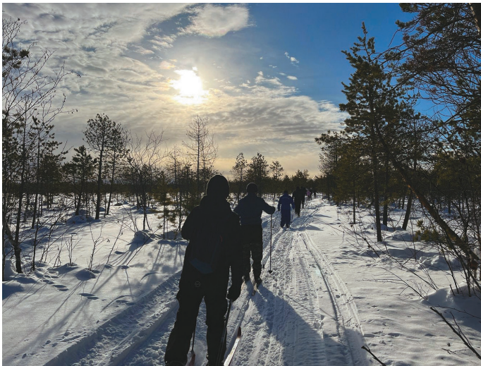
Мәхум товтыл ёмёгыт

Т ы этпос 1-4 хөталытт Хальёус районт ёлнэ мәхум товтыл хайтсыт, ты касыл «Лыжняй Андрея» ләваве. Касың тэлы-түяг акв порат мәнълат агит-пыгыт, нъяврамыт товтыл Саранпәвылныл ос Кульпасныл Лөпмусн минэгыт. Мәхум 2009 тәл пәсныл касың тәл тох акван-атхатыглэгыт. Ты тәл «Лыжняй Андрея» нампа касыл вәрыглан пәсныл 15 тәлэ төвлыс.