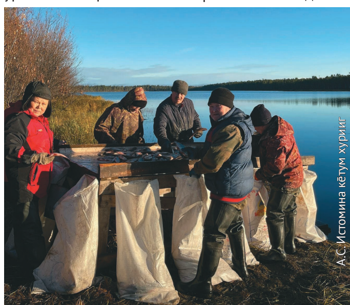
Аквьёт рүпитан мәхманэ