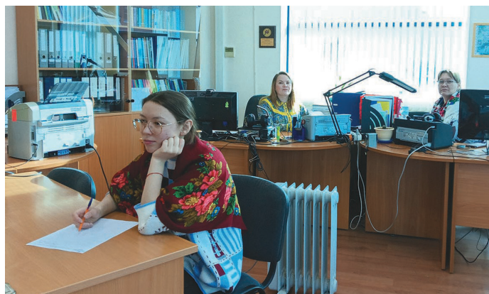
Мяхум потыр мәнщи ләтңыл хансэгыт

– Тамле потырам кәсың тәл хансэгум, тыхөтал