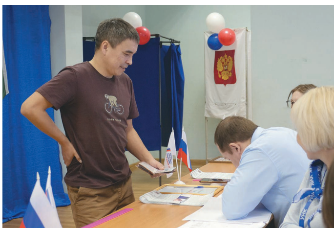
М.А. Анямов нәпак тәратаңкве ёхтыс