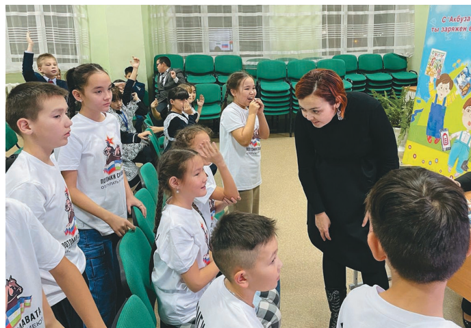
Айгуль Габитова няврамыт ёт потырты