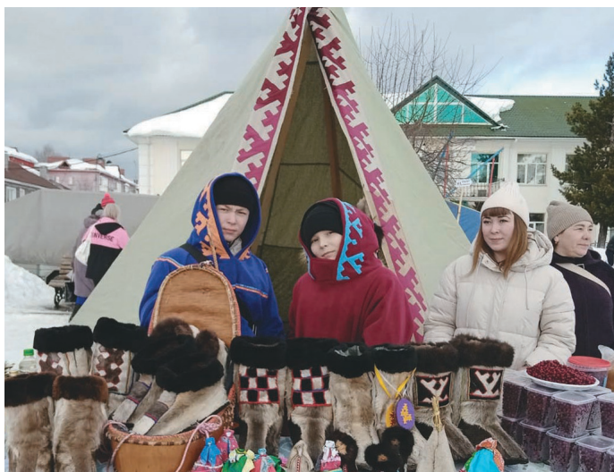
А.В. Анямова ёмаспал нупыл ләлы

хөтхуйпулув мәншиц олы. Тәлтә пәвылт хөт мәншиц хөтпа олы.