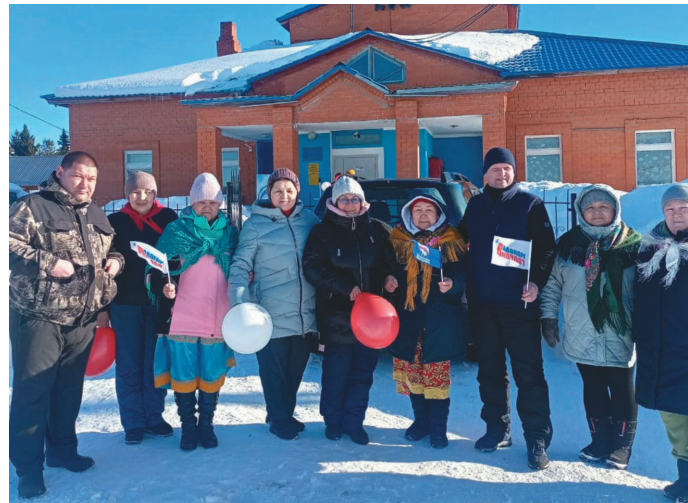
Мэхум товтыл касуңкве ёхталасыт

Ам ос товтыл ёмнэ хөтпат кәсаланэм порат номсэгум, тән вәгтал патыглэгыт аман әти, ёмнэныл нэмхотьютаныл вәгтал ат паты, ат кәнтлы. Пуссын акв юи-пәлт акв кёмыл пәвлувн кит пәлыл «лыжниканув» сампосны нәглэгыт. Ты тәл сәртын Саранпәвыл мэх-