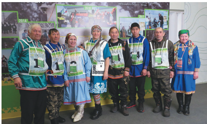
Касум пәвылныл ёхталам сәлы үрнэ хөтпат