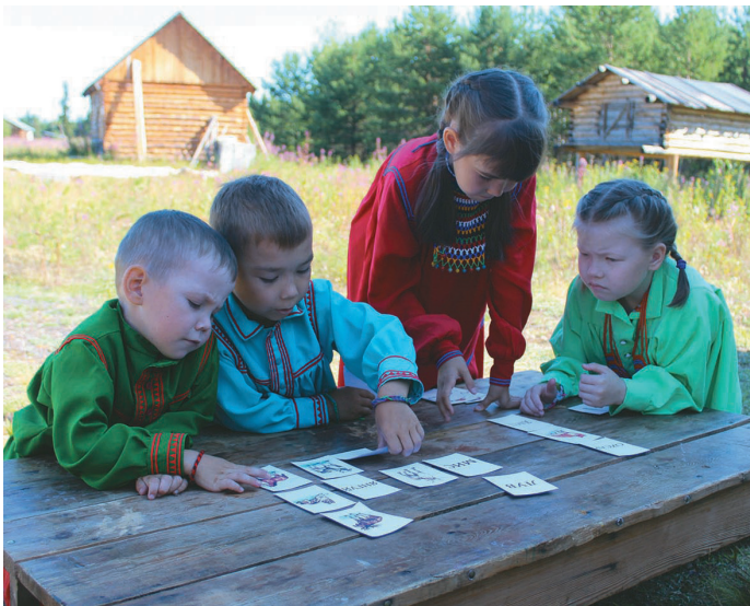
Мәнь нъяврамыт щәнь ләтңув хаництыяныл

Х альүс район Ясунт пәвилт «Мәнь Ёскве» нъяврамыт үщлахтын мә 1994 тәл пәсныл рүпиты. Кәсың туи сәв нъяврам үщлахтуңкв ос блуңкв тув ёхталы. Тәнанылн тот пұмыш вос блыс, тот рүпитан хөтпат матыр-әти йильпи тәла акваг та номылматәгыт, акваг та вәрәгыт.