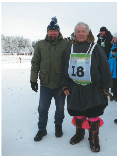
Александр ос Николай Тасьмановыг