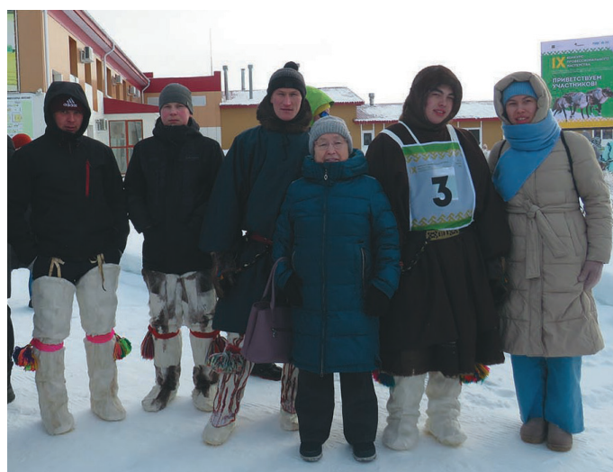
Саранпәвилныл ёхталам мүй хөтпат