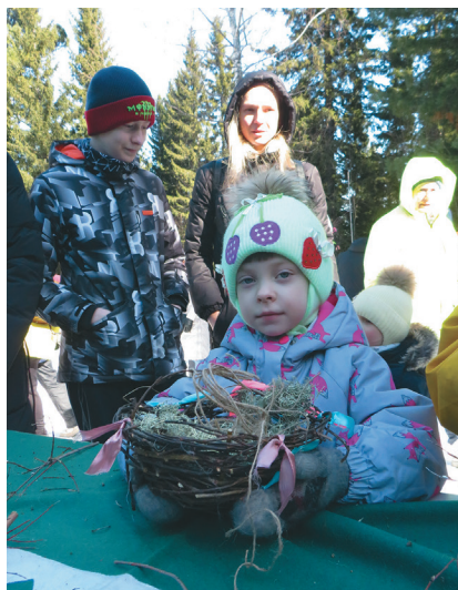
Мargarита пити вәрис

– Музейн нъявраманум ёт кәсың тәл ёхталэв, ты ялпың хөтал тән сака ұрияныл, акваг тыг