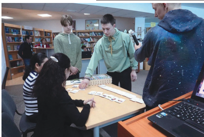
Нъяврамыт ёнгынут суссылтэгыт