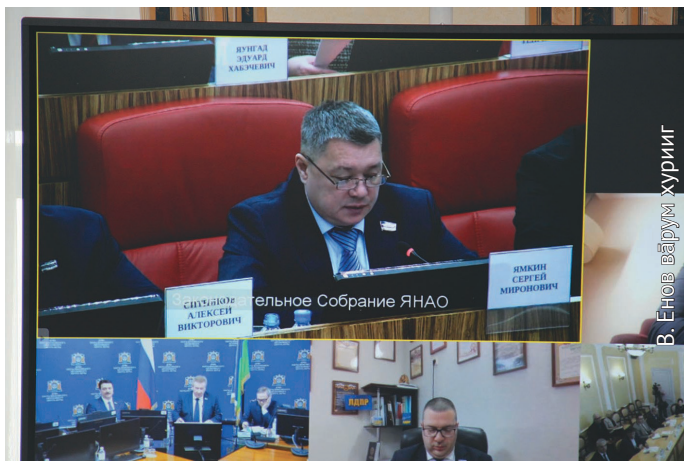
Халанылт тох потыртасыт