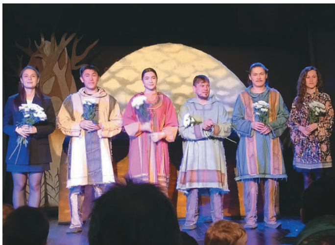
Мōйт суссылтам артистат

Ты ёнгилт тāн сака пūмыщ ос нётнэ пōслын хуритыл суссылтавет, артистат такем ёмщакв