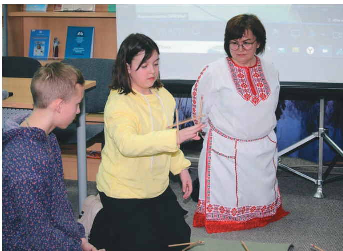
А. Петрова «Щёл» ёнгил суссылты