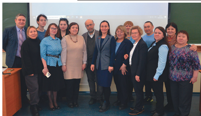
Мәньщи, ханты ос учёный мәхум