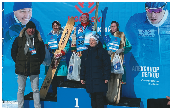
Нөх-патум нэквет Н. Комарова янытлыянэ

Тувыл мак пумыщ касыл олыс – маньщи ос ханты мэхманув танти супанылтыл масхатым ёсал та хайтсыт. Тит хотпаг катыт йив-овыл ошсыг, мотананыл йив-овыл тал хайтсыт. Ёсат ос савсырыг олсыт, товат уй котыл паттымат, товатос партныл вэрим товтыт, мотаныт ос лапкат ёвтымат.