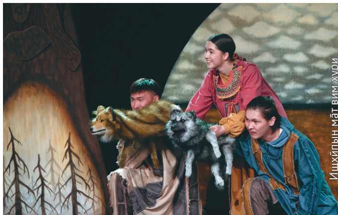
Ищйпың мāt вим хўри

Театрыт рўпитан хōтпат мāн ялпың хōталаныл кастыл янытлыянўв ос сāv шунь, сāv сōт вос оныщёгыт.