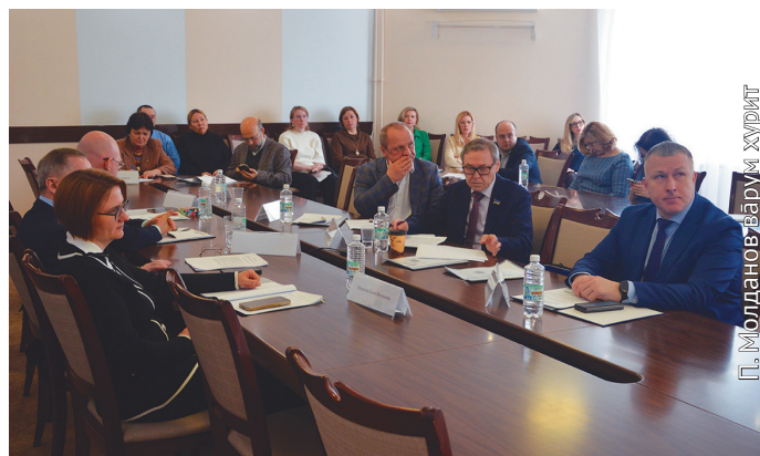
Яныг кӯщайт ос учёныит акван-атхатысыт