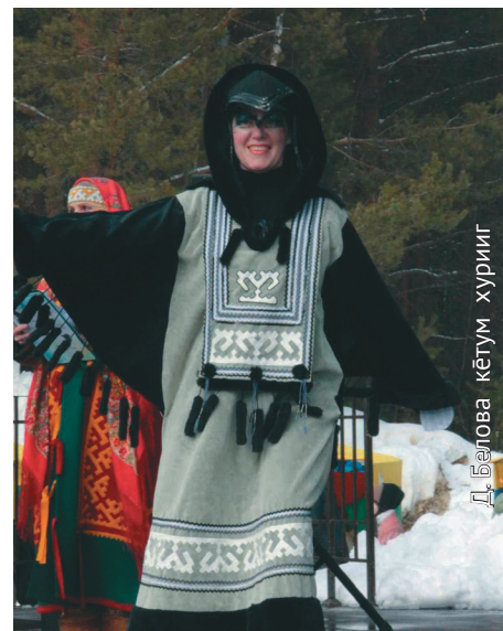
Д. Белова кетум хуриг