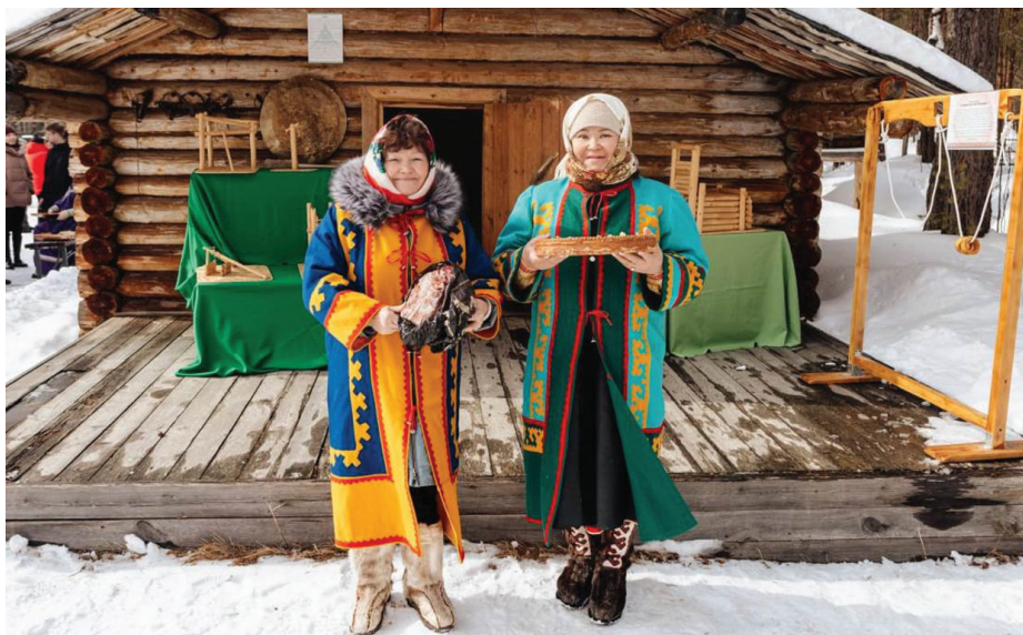
Д. Белова ос Л. Волкова мүй махум үрөг