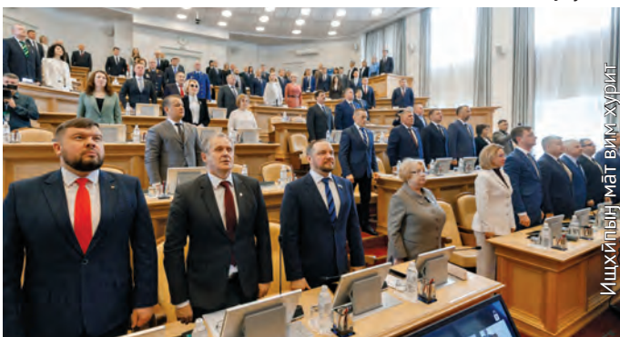
Ишхитың мәт вим-хурит