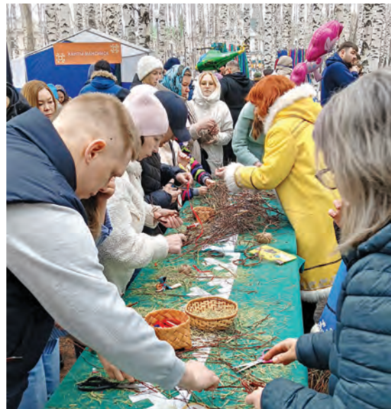
Янге-мәне үйрищ пители пёрытэгыт

Т ы этпос 5 хөталәт Ханты-Мансийск үс мир Борис Лосева үшлахтын кант «Үринэква хөтал» янытласыт. Овләт концерт суссылтавес, «Хөтал» нампа ансамбль мәхум эргысыт, ййквсыт. Мөт районтыныл эрыг тотнә хөтпат өс блсыт.