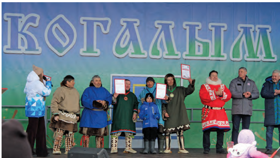
Нөх-патум ма́хум янытлавет