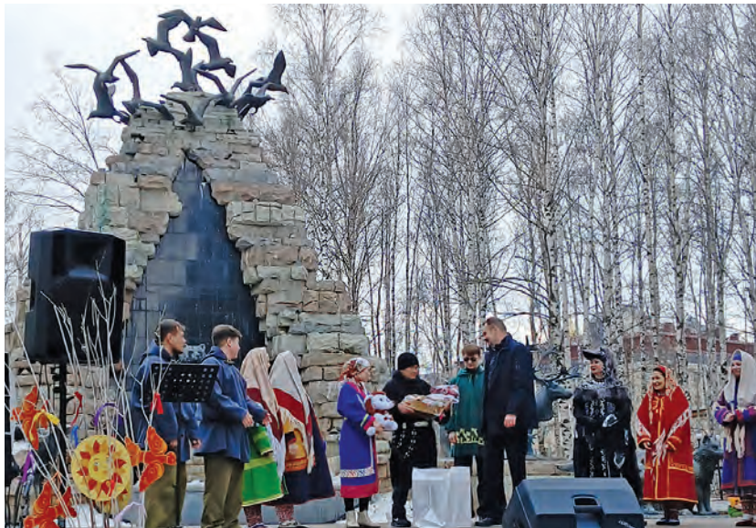
В. Кольцов самын патум ханты аҗирищ колтәглә янытлытә