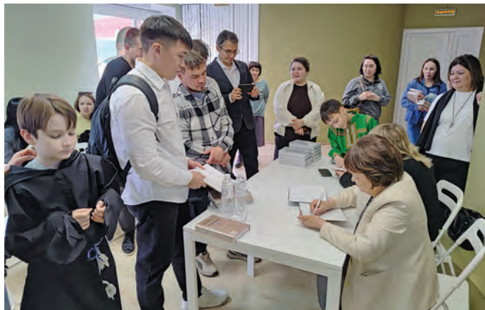
Мэхум нэпакыл мивет

Ань ханты ос мәнъщи мэхманув акв номтыл вос рүпитасыт, «Югра лылыёп» ассоциация рүпататэ ос Үй ййквнэ тэла урыл кит нэпакыг ты тәратавёсыг. Ты нэпакыгт сав яныгпәла хөтпат ос няврамыт хурияныл кәсалаңкве рөви. Мэху-маквет, нән ты нэпакыгт ос ловиньтән, тот сав пёс вәрмалъ урыл хансым өлы.