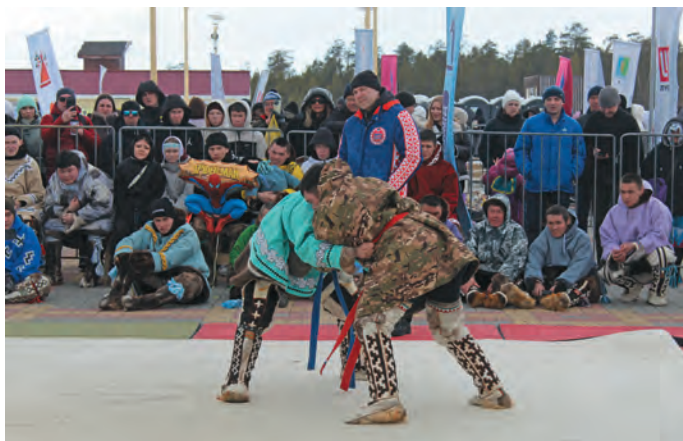
Хум хөтпаг пёрщев

– Мән Когалым үст блэв. Вөрт колув блы, мәнти сәлыт оныщев. Ам хұрум няврам янмалтәгум. Данил пыгум такви сәлыт оныщи, сәлыңсун оныщи, яласаңкве ханищтахты.