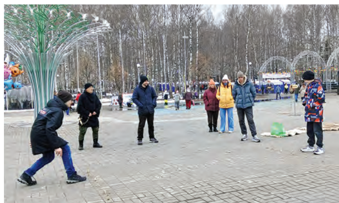
Пыгрищит лувөвлытыл әнгасэгыт