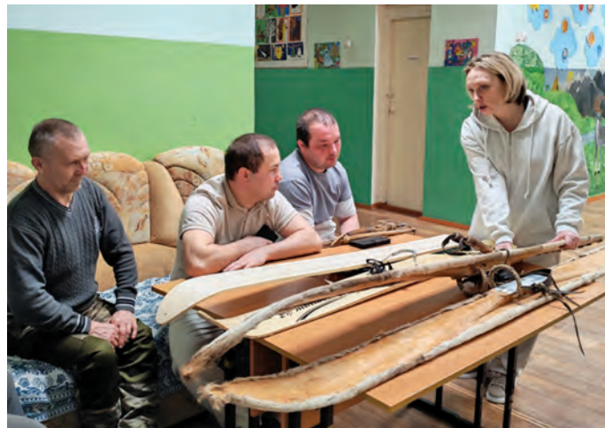
Е. Савчук ёсат урыл потырты

Олкевт, вәим, тәва няврамыт Хәсдох мус ёхталәгыт манос Хөрыңпәвил мус ос тувыл ювле та воратәгыт. Мән тәнаныл буранын тәлттым ювле та тотыанүв. Сәв щәс бураныл тыгле-тувле яласаңкве бәс ат вәрмөв, тәнт товтыл миннә ләңхув молях хот-сакватылүв ос ювле ёмантаңкве бәс тәрвит ёмты тах. Янгыщ мән пыгрищиттәнки ёраныл ат вәнәг паттат ос тәнкинәныл сәлитым ювле хультәгыт. Төват хаштәл элы пәвилн ёхтынәныл порат хурахләгыт,