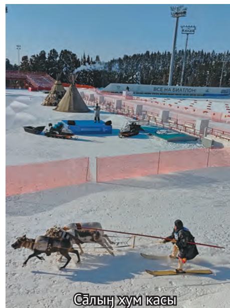
Сәлың хум касы

Түяг, хунь мән сәлыт нәглапёгыт, тән вөртөлнүтын ос хәйтнүтын алапаңкве вәрмавет. Төнт Саранпавылтын мәхум пәстух хөтпатн нөтуңкве ёхталэгыт. Та порат сәлыт этә-хөталэ уральтаңкве эрэгыт, хумыт кит хөтпал рүпитэгыт. Дмитрий сәлың лүтың тәгыл нёрыт янытәт яласасанэ, Коми республика нупыл ос сәв щёс ялыс. Та нөтнэ нёрың мәкве тавән сака мүсты.