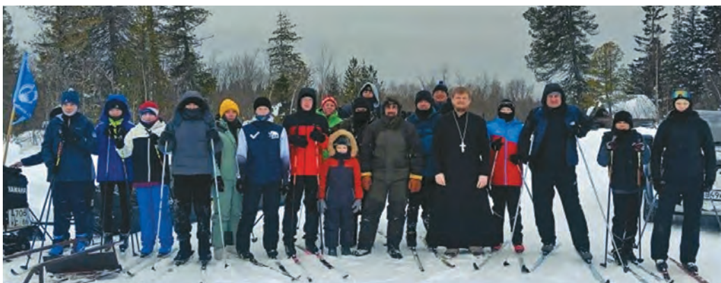
Товтыл хәйтум Саранпәвил махум

Мән пәвлың мәт өлнэ ос товтыл хәйтнэ махманув тох та өлөгыт. Тән щәгтаныл акв ос тәрвитаныл акв, тәнки халаныл акван-нөтхатым пуссын мөтыт тәл өмтнэ касыл үрөгыт.