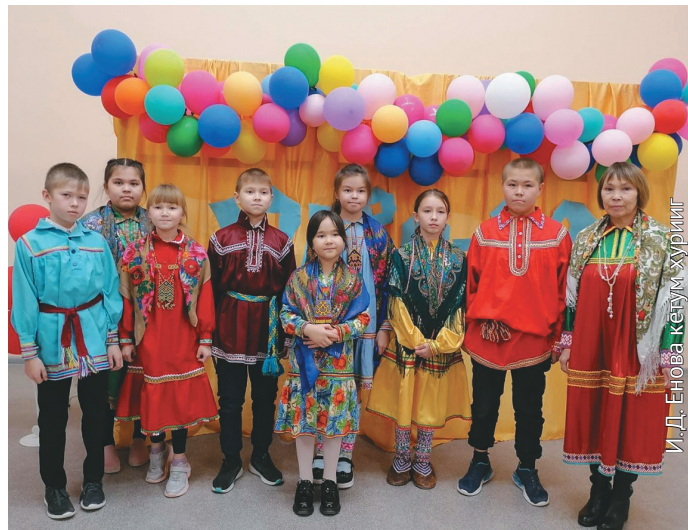
Ханищтам нъявраманэ ёт

Мөлты тәл 62 әгирищ, пыгрищ школан ялантасыт, ты тәл мощцанув. Ам нилыт классумт туп 8 нъяврам өлыс. Ань сәв мәхум Хальүсн вәнтләгыт манос мөт мән миныг-ләгыт.