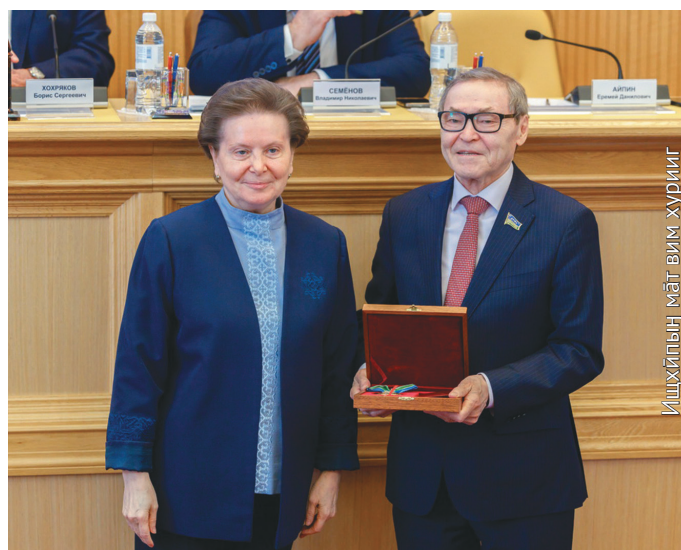
Ишхйпын мәт-вим хуриг