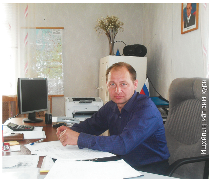
В.А. Лукашәня, Кондинский пәвыл миркол күщай

Мәхманув ос щар ат номсахтэгыт, тох хүл тәл хулытэв. Рыбинспекцият рүпитан хөтпатн тувле тәланыл щар әтим. Юи- өвыл тәлыт Конда я витә сака мәниг ёмтыс, тымәгсыл хүл ос әтим.