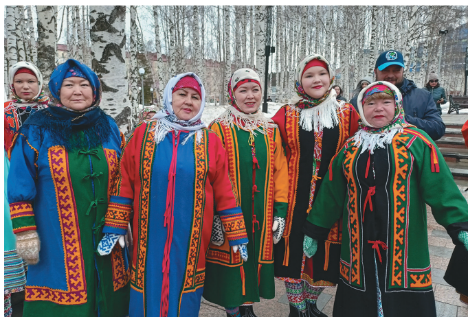
Белоярский үсныл ёхталам нэкет

«Хөтал» нампa Асугорский театр махум татем ёмас спектакль