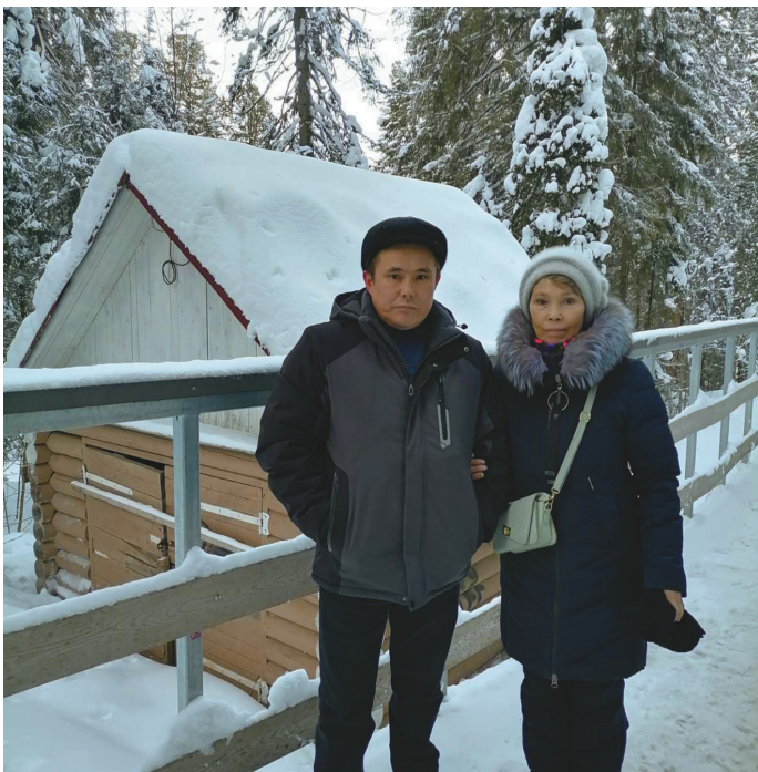
И.Д. Енова пыге ёт

Ирина Дмитриевна Енова, Өпарищ наме Миляхова, 38 тәл нъяврамыт ханищтан хөтпаг Хальүс район Тэк пәвилт ос Ямал мәт рүпитас.