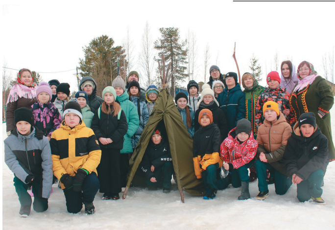
Уринэква хөтал мўйлум мэхум

Ань нан соссаң мэхум өлнэ вәрмалил мэхум ақваг пўмшалахтуңкв патсыт: мәнъщи мэхманув ос ханты мэхмыт халт Уринэква хөтал ақваг янытлаве, нъяврамыт мәгыс мўйлын хөтал ты кастыл вәраве.