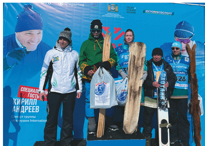
Сосса махманув яныглавет

Олег ос Денис щанягён ягагииг ёлэг. Тэн лавсёг, Няхщамвёльн, Яныгпавылн тан акваг