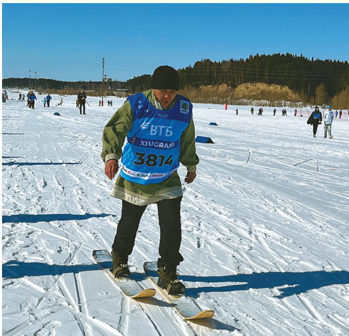
О. Куриков ёсал ёми

Т ы этпост Ханты-Мансийск усувт яныг касыл ёлыс. Тув сав маныл махум товтыл хайтуңкв ёхталасыт. Сосса махманув ёсал янас хайтсыт, тан халанылт маньщи супыл масхатам акв хум лёляхёлыс.