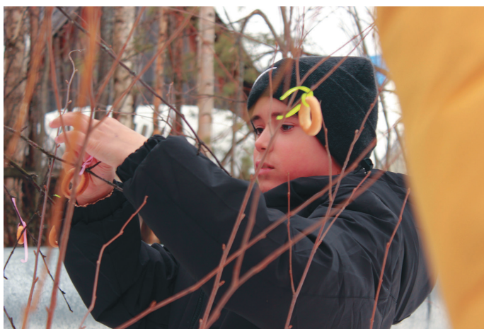
Пыгрищ кәлащ нәги

К асың тўя, тўя ёмт ўринэква ақув мөртым кўит халт тав та сартын лүймән ёхтыгпи, тўя хөталыт товлаге тармыл ёт-тоты. Тавёныл та тараң – тўя-палаг та патыс, ащирмаг воссыг ат ёмты. Касың хөталэ ёмт ақв мълтыпыг-ақв мълтып та ёмтанты.