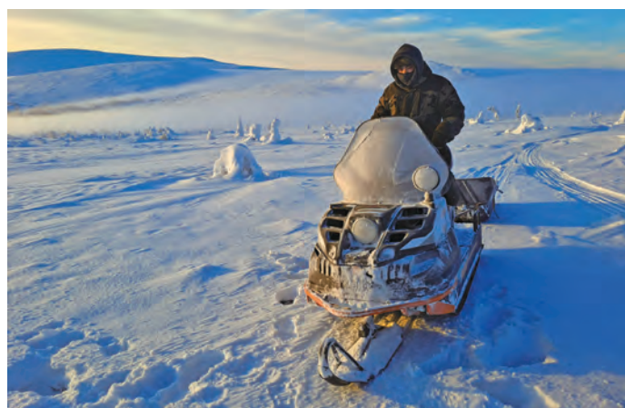
А. Дунаев «Бураныл» минь

Пәвлын ёхтыгпас, кўтюв кон ёл-нәгасты, такви кол кйвырн щалтыс. Та порат пәвылт нәмхотьют аitim блыс. Пуссын хоталь минасыт. Бйка пәлна