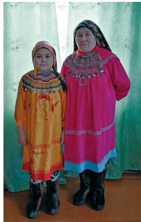
З.П. Тоголмазова Тая апыгрище ёт

Остеров Кульпасныл олыс. Каңк оньщёгум, наме Женя, увшим Анна. Тән сас колтаглыңыг-няврамыңыг ёмтсыг.