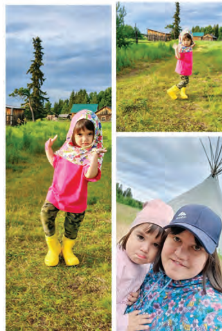
Виктория агирище ёт

Ос хунь хотты кабинеты рүпата ләккаранув үщлахтуңкве минэгыт, ам тув рүпитаңкве вәвыглавем. Ам кәтыл рүпитаңкве ханьщувласум, нәпакыт хансуңкве щар ат кос таңхәгум, тувыл