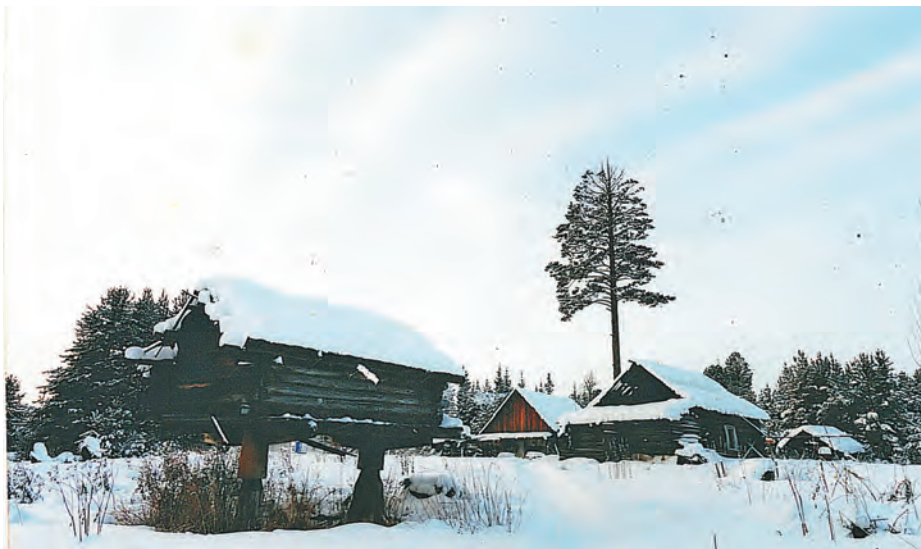
Лэпла павыл, 2013 тәлт пөслувес

өпарищ наманыл Самбиндаловыт. Мәхумыт пёс йис тэлат щирыл өлэгыт, вөраөгыт, пил вәтэгыт. Йтипалаг махманув палт ёхтысүв, тот хулмыгтасүв. Тувыл ётыхөтал элаль Лэплан минмыгтасүв.