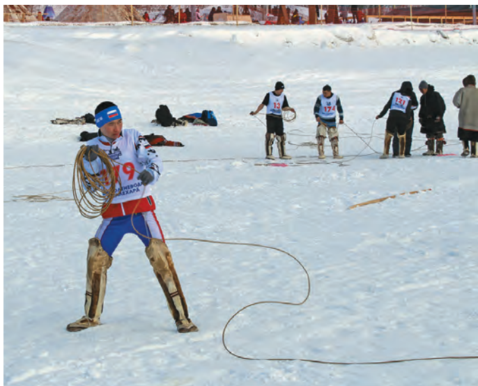
С. Лаптандер тыньщаң сөхты

А нь йис мәнлат мэхум тәксарыг блуңкве воратэгыт, тыи сака ёмас вәрмаль. Ос сасса мэхум каснэ хольт янас касыл блы, тав «северное многоборье» лававе. Салехард үст сәлыл каснэ мэхум халт мәнлат пыгыт бс тәнти халанылт касэгыт.