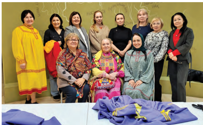
Мәньщи ос ханты нэт