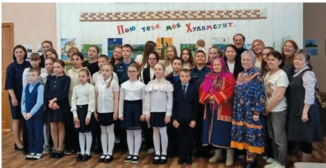
Ханищтахтын нйврамыт ос школан ёхталам нәт