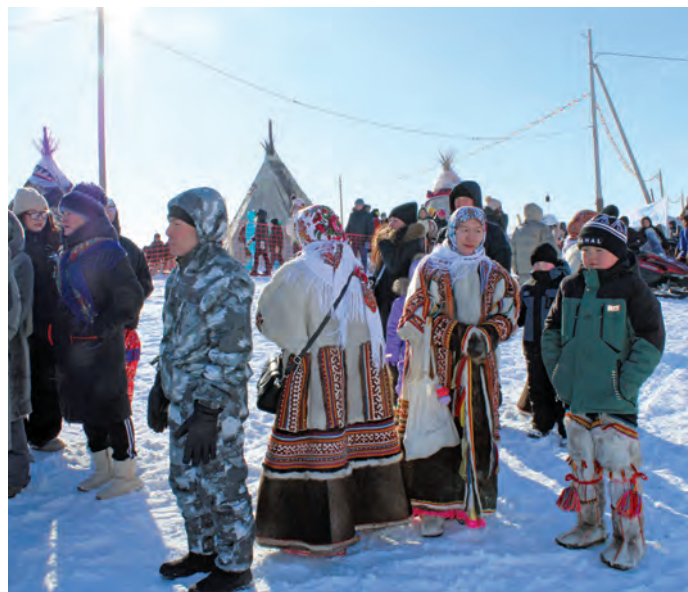
Ямал мāt тох ты нётнэг масхатэгыт

– Ань тыньщаң пәхвтын мәгсыл щёсыт хумус ловинтавет?