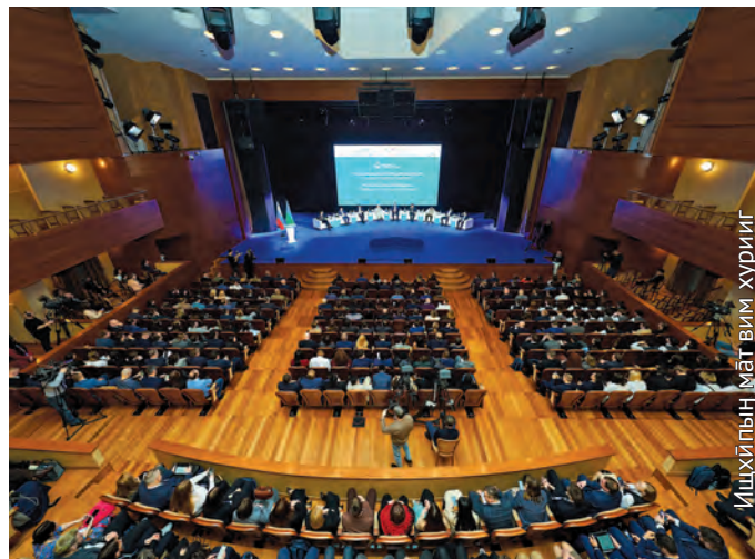
Югра-Классик колт мир атхатыгласыт

Я ныгпöль Этпос 8 хöталэт Ханты-Мансийск үст мәнълат мэхум мәгыс «Нефтяная столица» нампа IX мирхал форум öлыс. Тув сав мәнълат учёный элумхöласыт, специалистыт ёхталасыт. Касащан мэхумыт потраныл ловиньтасаныл.