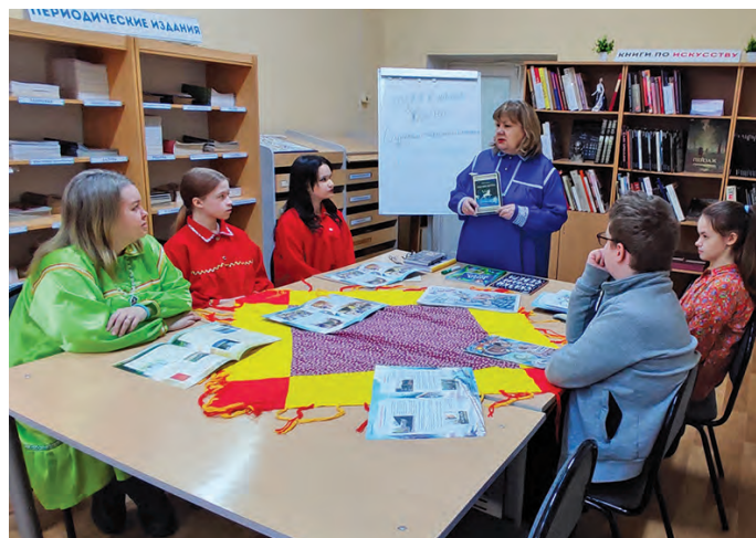
А. Горлова потырты

Нъяврамыт хансум мөйтаныл ань акван-атавет ос пуссын «Шицнай ойнас» нампа нэпакн щёпитавет. Мөйтыт мэгсыл