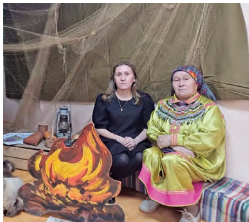
Екатерина ос омагэ Зоя Петровна пёслым оlэг