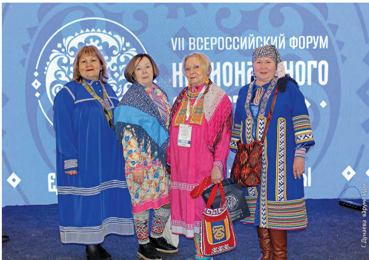
Г. Дунаева вәрүм хури

Ты хурит мәнъщи нэт пӱслым блӱгыт. Тынакт Ханты-Мансийск ұст «Всероссийский форум национального единства» нампа вӱрмалъ блыс. Тув сӱв мир атхатыглас. Ты урыл 2 лӱпсыт ловиньтӱн.