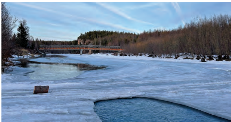
Лүсум я үлтта вәрим унсах