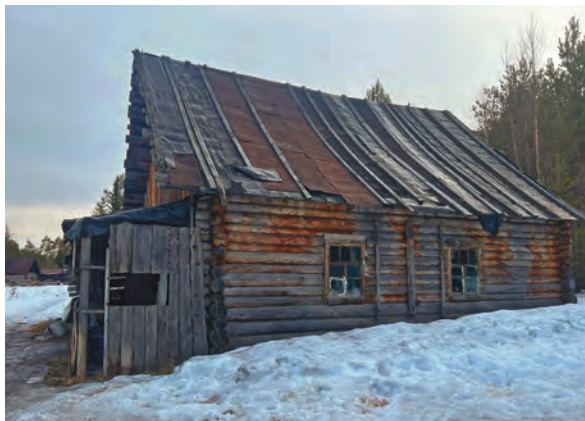
Лэпла павылт ань пөслым пёс кол