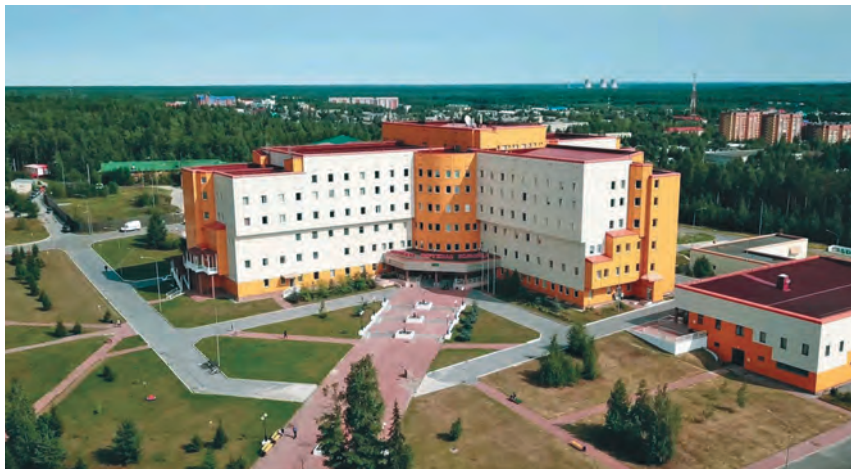
Нягань үс пұльница

Н ягань үст Тамара Петровна Лаптева, такви бпарищ наме Тарлина, ханты нә блы. Тав сәв тәл пұльница тәл ләккарыг рӯпиты. Мблал мән тав ётә хәнтхатыгласүв. Нә такви рӯпататә ос блупсатә урыл моц потыртас.