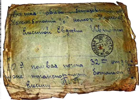
Ащойкав кетум пищма

«Паша Щетино павлыл. Ам нанан паша латың кетэгум, ёмас олупса вус олы. Ам сака ёмас ат олэгум, лув ат кос оныщёв, ос рүпата төвлы. Ань амки нэпакум кетэгум, та нэпак щирыл наң вёрмёгын нётмил виңкв. Ам хурум хөтал агмыл олсум, ань ос агмыңыг ёмтсум, ос номсэгум, мощёртын пусмөгум. Хөнтлан маңыл хус вёрыстат олэгум, пилыщмаң ут иң нэматыр атим. Номсэгум мощ олэгум, тувыл юв ёхтэгум.