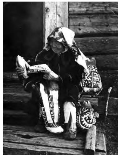
Д.С. Анямова вәй сунсыгылы

тәнүт, маснут әтим өлыс. Яныг анёкquam манкөм ёре-вәге ёхты, акваг рүпитас, ёмас өлнэ хөтал ляпамтас.