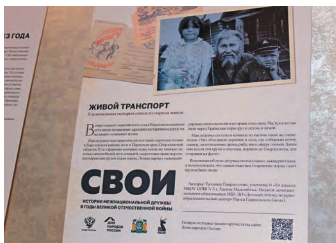
Няврамыт ос яныгхөтпат хансум потрыт

минасыт, таит пувим мāt Подмосковьяныл Германия мус хот-нявлысаныл. Миннэв порат сәв лёль капай вәсүв, хумус фашистыт пәвлыт, үсыт сакватасыт, щар лёль вәрнутыт, ййвыт ханащлан ос мән ат щёпитым мэхумыт акваг вәсүв. Сосса мэхумн нётмил вәруңкве эрыс – няврам самын паттысыт, нюлмит юнтсыт... Мэхумн пуссын нётсыт.