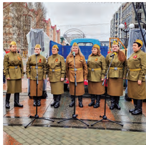
Нэ хөтпат эргёгыт

Тот кәсың хөтпа хөнтлуңкве ялум манос войнат порслым ащөйкатэ, Өпатэ, мөт хотты рүтэ хури ос нам тув хансым кәтыт пуви. Ты хурит суссылтым пуссын үскан памятник мус минэгыт ос акваг тәнэ нәй ляпан хорамың лүптат пинэгыт. Та хөтал Ханты-Мансийск үст әлпыл пәсыл раквыс, янге-мәне тувле нупыл ат номсахтым яныг үсканын мүйлуңкве атхатыгласыт. Тәнаныл округ кұщай хум Руслан Кухарук янытласанэ, тав ләвыс: