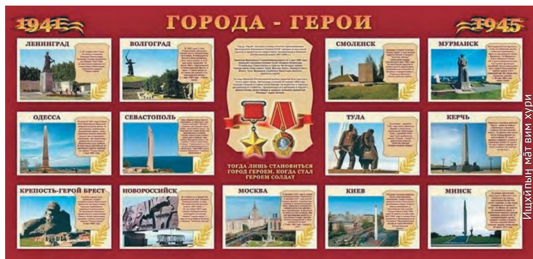
Ишхыптын мәтвим хури

1941 тәлт лүпта этпос 28 хөталт фашистыт Минск ұс висаныл ос тав ляпатәт 400 сөтыра арыг-