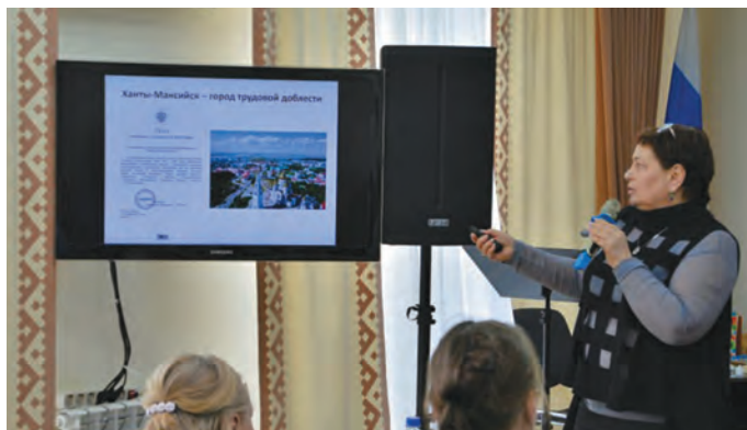
Л. Косполова потырты

1941 тәлт округув янытыл 91 сөтыра элумхöлас блыс, тән халанылт 17 сөтыра хөтпат хөнтлуң-