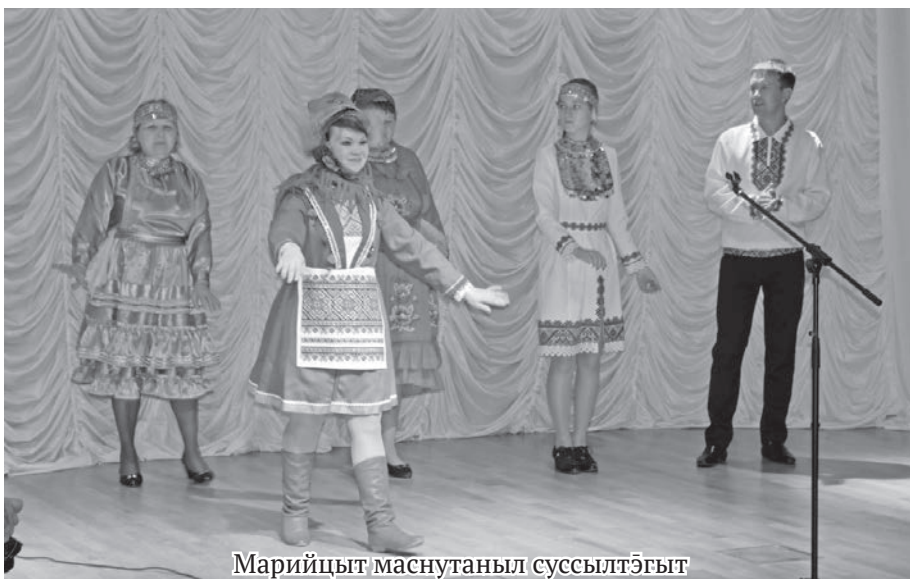
Марийцыт маснутаныл суссылтэгыт