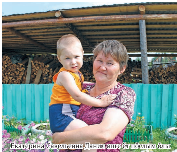
Екатерина Савельевна Данил апаге эт послым олы

– Ам мәнъполь этпос 24 хөталэт 1968 талт