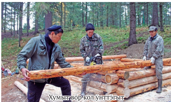
Хумыт вӧр кол унттӧгыт