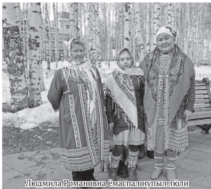
Людмила Романовна эмаспал нүпыл лүбли