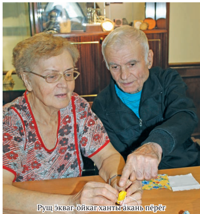
Руц экваг-ойкаг ханты акань пёрег

урыл нёматыр торың ат вагыт. Та титыглахтэгыт, манрыг аканит тох варавет, вильт манрыг ат оныщёгыт, саманыл манрыг ат пославет. Ос та соссаң мир олупса урыл потыртавет.