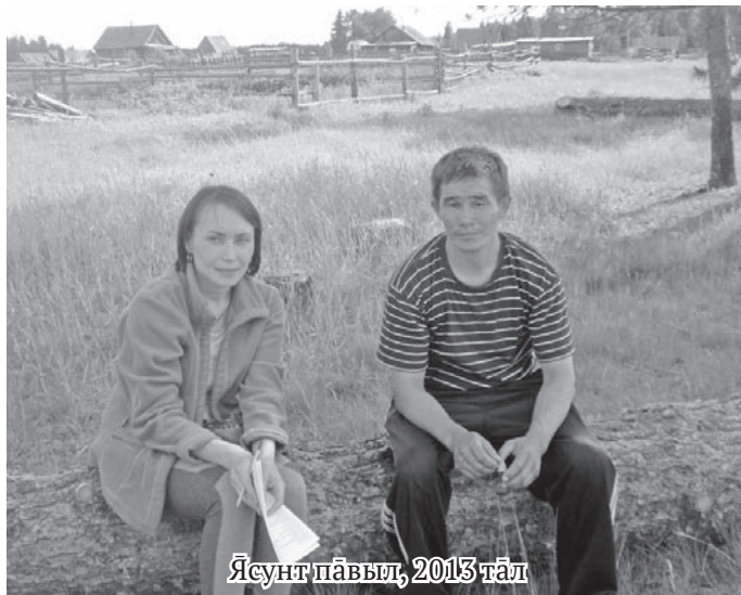
Ясунт павы, 2013 тал