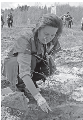
Округ кўщай Н. Комарова наңкйив ўнтты

2017 тал Россия янытыл ма-вит ўргалан талыг тах лававе. Ань ты ёмас вәрмалъ ма-гыс ман округувт ты олнэ талув сьс сав ёмас рупата вәрвес. Ты урыл нила хум хўтпа потыртасыт. Тан ляххал тотнэ махум ёт хонтхатыгласыт. Касыңе янас потыр оньщис.