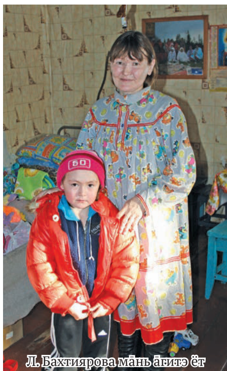
Л. Бахтиярова мāнь āгитэ ёт