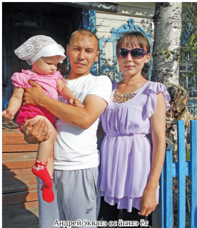
Андрей Экватэ ос агитэ ёт

Ам культура Центр колт рупитан хотпатн пуштагыл олнэ латың кётэгум. Андрей щемьятэн ос пуштагыл олнэ латың лавэгум, Төрүмн вос ургалавет.