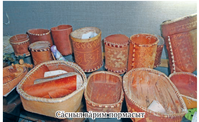
Сасныл вэрым пормасыт

Ты культура Центр кол 1991 талт рупитаңке патыс. Ань тот ханты нэ Раиса Петровна Загородняя кұшаиг рупиты. Соссаң махум та колн ватихал атхатыглэгыт. Ялпың хоталыт олыгланэныл порат концерт вэрыглэгыт. Атың тэнутың пасан