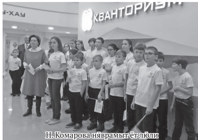
Н. Комарова нйврамыт ёт лōли

Ты кол ўнттуңкве «ГазпромТрансгазЮгорск» нампа компания олныл нётыс. Наталья Ко-