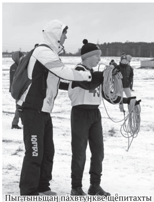
Пыг-тыньщаҥ пӑхвтуҥкве щӑпитахты

Ӑвил хӧтал ныврамыт акван-атыглавӑсыт ос