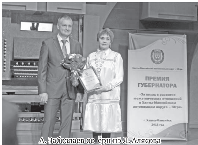
А. Забозлаев ос ёрн нё Л.-Алясова

Ты этпос 5 хоталёт Ханты-Мансийск ўст КТЦ «Югра-Классик» колт мāхум «За вклад в развитие межэтнических отношений в Ханты-Мансийском автономном округе – Югре» округ кўщай нампа премиял майвёсыт. Мāн мāvт тамле вāрмаль ань атыт тāl ты олыс.