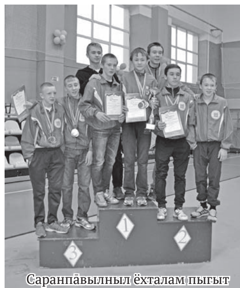
Саранпáвылныл ёхталам пыгыт