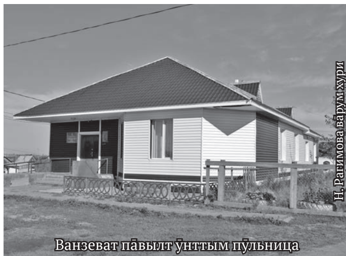
Ванзеват павылт унттым пүльница

рупитэгыт, сав эрнэ тэла вәрэгыт, ань округ янытыл махум пустагыл вос өлэгыт, ныврамыт самын вос патэгыт. Та минам талт Россия янытыл мән мавт