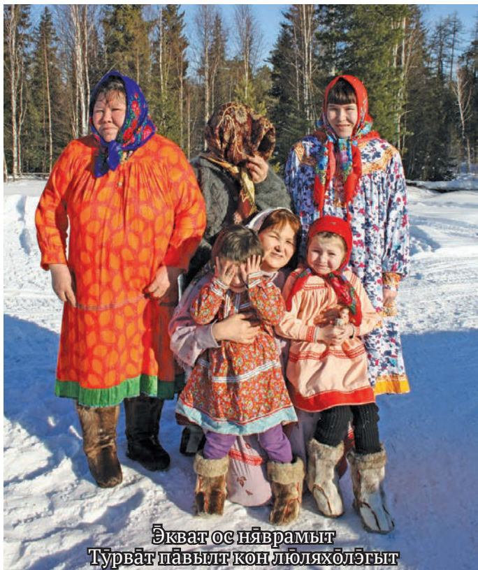
Экват ос ныврамыг Түрвāt павылт кон лүблхōлэгыт