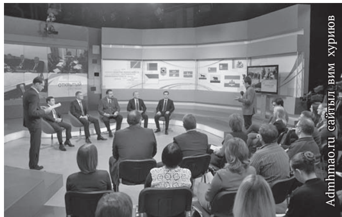
Admha0.ru сайтывл вим хуринов

Ты коныпал тāн кāсың тāl ханищтахтын нэпакыт, пормасыт ёвтнэ мāгсыл ос тāl сьс акв щёс юв ялантан мāгсыл олныл мивет. Мōлты тāлт ты нярвaмыт мāгсыл округ бюджетныл 36 млн. солкōви тāстыглавес. Ты олныл 580 нярвaм нётвёсыт.