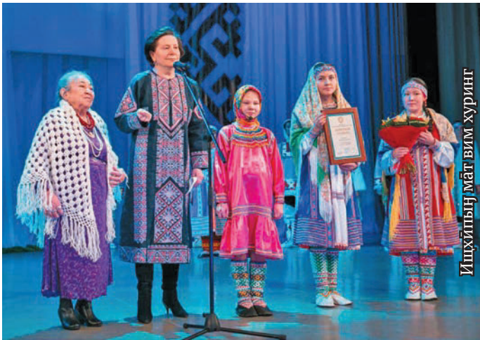
Ишхйпын мят вим хуринг