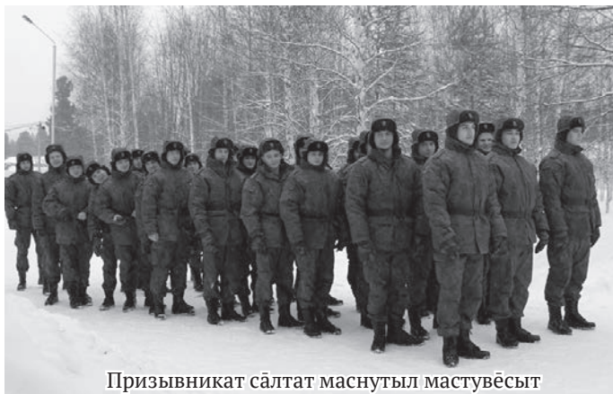
Призывникат салтат маснутыл мастувёсыт